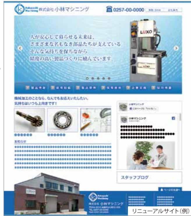
リニューアルサイト(例)

ずいぶん前に作ったホームページも、更新しなければ何の価値も生み出しません。検索したお客様も、表示された古い情報に、よい印象を持つことはないでしょう。今、始めませんか。ホームページのリニューアル!