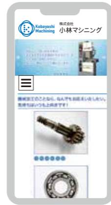
スマホサイトも同時制作