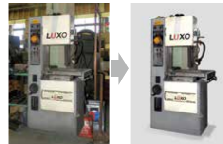
背景の切り抜きや汚れの除去など、様々な修整にお応えします。