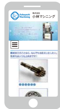
スマホサイトも同時制作