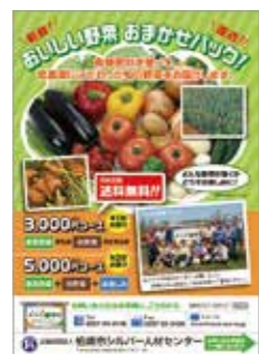
通信販売フライヤー (柏崎市シルバー人材センター様)