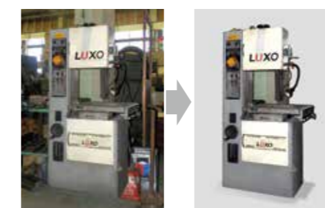
背景の切り抜きや汚れの除去など、様々な修整にお応えします。