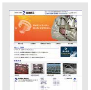
高喜鉄工様(聖籠町)