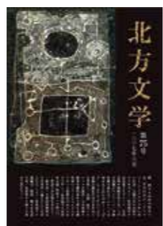
同人誌表紙リニューアル (玄文社様)