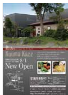
オープン告知フライヤー (クーマカツ様)