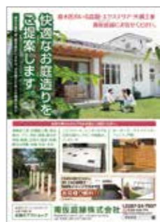
一般広告フライヤー (甬仮庭緑様)