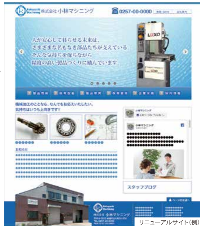
リニューアルサイト(例)

ずいぶん前に作ったホームページも、更新しなければ何の価値も生み出しません。検索したお客様も、表示された古い情報に、よい印象を持つことはないでしょう。今、始めませんか。ホームページのリニューアル!