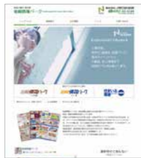
広告代理店ホームページ (ノザワ広宣社様) ※共同制作