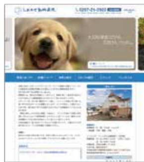
動物病院ホームページ (しおかぜ動物病院様)