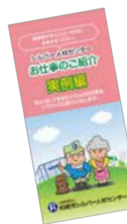
会員募集リーフレット (柏崎市シルバー人材センター様)