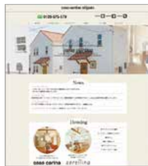
不動産会社ホームページ (カーサカリーナ新潟様)