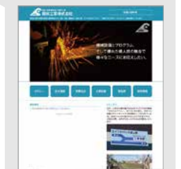
親栄工業様(妙高市)