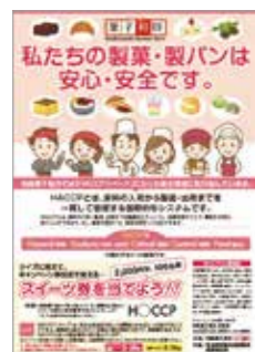
キャンペーンフライヤー (柏崎菓子組合様)