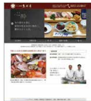
寿司割烹ホームページ (魚河岸様)